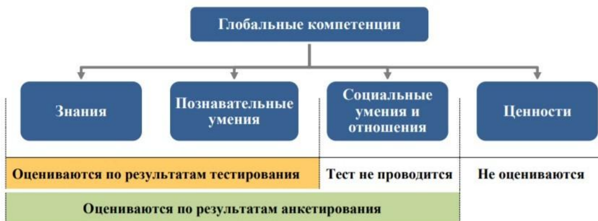
Рис. 2. Подходы к оценке глобальных компетенций